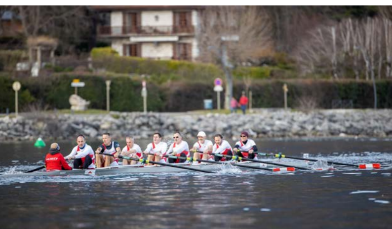
Confirmation du succès de la "Régate des 3 Châteaux" avec une seconde édition qui souhaite installer cette nouvelle compétition comme un rendez-vous majeur de l'aviron en France