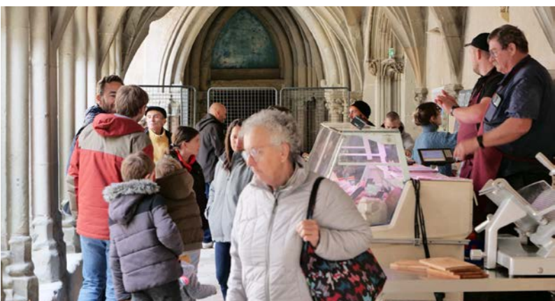
"Marché Gourmand" du samedi 25 mars 2023 : malgré une météo un peu moins clémente que lors de la première édition, ce rendez-vous s'est terminé sur un satisfecit des organisateurs et des 28 artisans et commerçants qui s'étaient déplacés au Prieuré et dans la cour d'honneur.

"Carnaval", "Régate des 3 Châteaux", "Course du Coeur", "Marché Gourmand"... les fêtes et animations ont été nombreuses lors des dernières semaines !