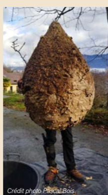
Nid récemment décroché Route des Tournelles

La colonisation des frelons asiatiques se poursuit et s'intensifie... un nid pouvant potentiellement donner naissance à 20 autres la saison suivante.