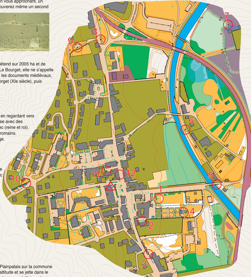
Carte de course d'orientation 2021 / Cartographe : Laurent Astrade / La reproduction de l'ensemble des supports cartographiques est autorisée pour l'usage unique de ce parcours permanent d'orientation et à l'exclusion de tout autre usage. Cet équipement a été mis en place avec l'assistance technique du CDCO 73 et de la LAURACD / Crédit photo : mairie du Bourget-du-Lac. Edition 2022.

Ce cours d'eau prend sa source au col de Plainpalais sur la commune des Déserts dans les Bauges, à 1176 m d'altitude et se jette dans le lac du Bourget, à 233 m d'altitude, un peu plus en aval d'ici, après un parcours de 28,5 km. Vous pouvez observer que la Leysse est endiguée pour protéger des inondations le bourg, les terres agricoles de la plaine puis le secteur de Savoie Technolac.