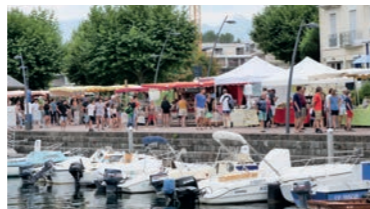
Malgré une météo difficile et l'annulation contrainte de 3 éditions, les marchés nocturnes au bord du lac restent une tendance forte et reconnue de nos étés bourgetains

Le nombre de visites guidées pour le château de Thomas II et du Prieuré a été une agréable surprise avec une forte augmentation de 36% par rapport à 2019.