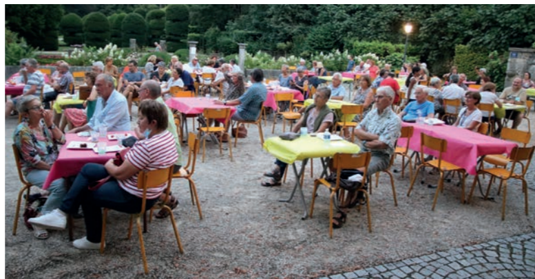
Nouveautés de la saison estivale 2021, les "Aperos lac et jardins" ont trouvé leur public tout en faisant la part belle à deux endroits emblématiques de la commune.