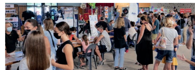
Retour en images sur l'édition 2021 du Forum des associations où malgré les restrictions sanitaires, 36 associations bourgetaines ont pu présenter leurs activités