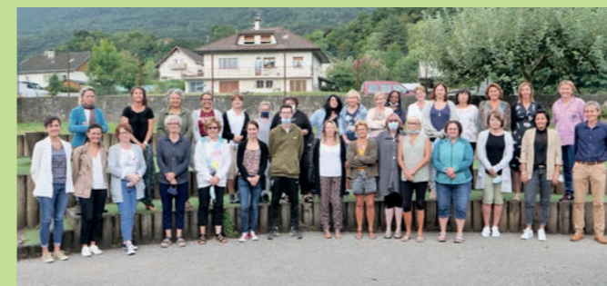
L'équipe du périscolaire lors de sa réunion de préparation "rentrée 2021"

Un travail sur un Accueil de loisirs durant les vacances est en cours (en partenariat avec la FOL, la CAF et la DDCSPP). Cet accueil qui, dans un premier temps, sera sous la responsabilité de la FOL, devrait être opérationnel, dès février 2022.