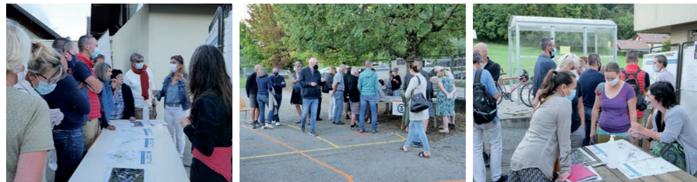
Après plusieurs mois de rencontres et de propositions, la dernière étape du processus de concertation sur l'aménagement et la sécurisation de la Serraz a eu lieu le 17 septembre.