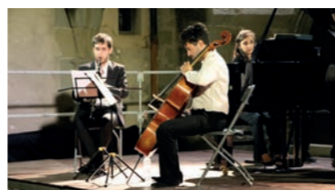
"Vide-grenier" et "Classiques du Prieuré" : deux événements marquants de la saison qui attirent toujours autant de monde au Bourget-du-Lac.