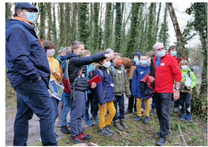
Campagne active de repérage pour le Conseil municipal des jeunes afin d'identifier les lieux propices aux activités et aux loisirs.

Pour leur première séance de jeunes conseillers municipaux, rendez-vous avait été donné ce mercredi 3 février aux élèves du Chat Perché et de la Cascade devant la mairie.