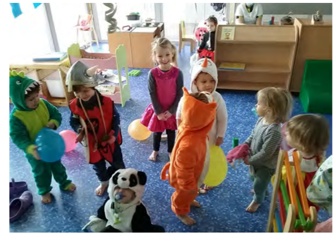
Mardi 16 février 2021, jour de carnaval pour les enfants de Pirouette.

Cependant, chaque section interâge "Eveil-Revard" et "Nivolet" ont pu profiter de ce moment festif. Les enfants ont pu se déguiser, se maquiller, danser et chanter durant toute la matinée tout en dégustant des crêpes préparées par l'équipe l'après-midi au goûter. Une journée particulière qui a pu ravir les enfants et toute l'équipe de Pirouette.