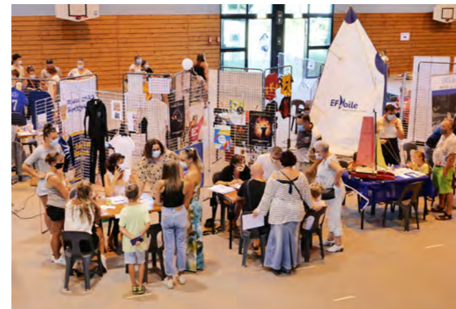
Malgré les restrictions sanitaires en vigueur, l'édition 2020 du Forum des associations a pu se dérouler à l'espace culturel La Traverse comme prévu et dans les meilleures conditions possibles.

La crise sanitaire que nous vivons et ses différents impacts dans nos vies rappellent à quel point le pacte social, l'intérêt général sont des valeurs primordiales dans nos sociétés.