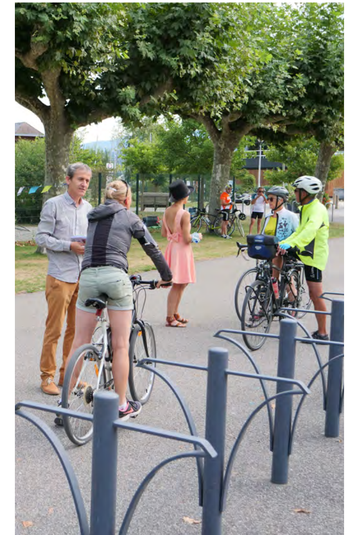
Concertation estivale des usagers : en seulement quelques semaines ce sont plus de 750 personnes (estivants, bourgetain(e)s, enfants...) qui se sont exprimés sur leur vision de la Croix verte.

Une solution simple pour l'ombre de la plage se profile avec l'agrandissement de celle-ci en intégrant la première allée de platanes.