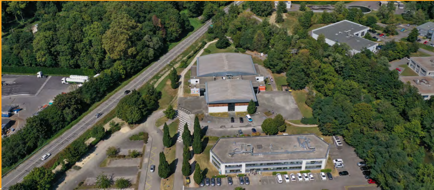
L'installation de la chaufferie à proximité de La Traverse restera compatible avec le projet de nouveau gymnase ▲