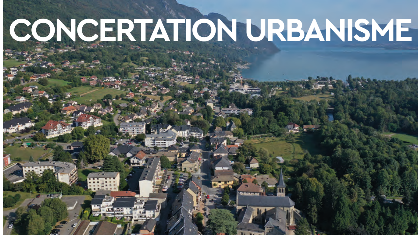
Vue du Bourget-du-Lac - septembre 2021