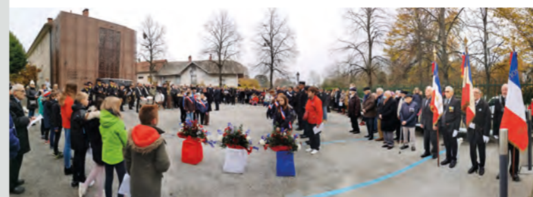
Les Bourgetains étaient nombreux à se réunir Place du Souvenir pour cette cérémonie du 11 novembre 2021 qui marqua, après 2 ans de restrictions, le retour des commémorations sans limitation de participants pour raisons sanitaires.