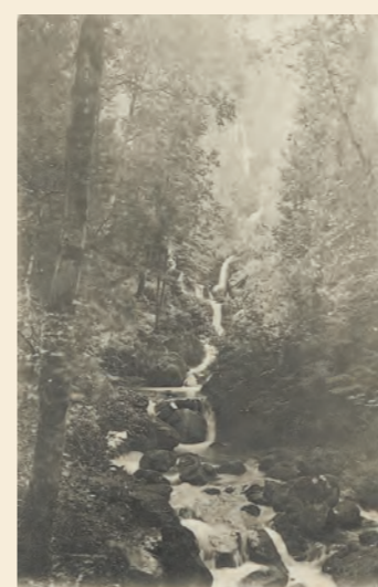
Cascade du Varon : elle donnait en amont, la force motrice aux Papeteries de Savoie et en aval, à un moulin.