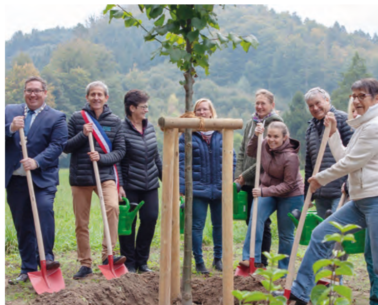
Élu(e)s et présidentes de nos deux comités de jumelage ont donné un temps fort à cette visite avec la plantation d'un tilleul, symbole de fidélité et d'amitié.

Après ces échanges amicaux et fructueux, il a été décidé de poursuivre ces contacts en 2022.