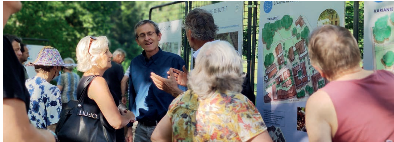
Lundi 5 juillet 2021 : la municipalité a présenté aux habitants les enjeux de l'aménagement de ce domaine de 16 000 m 2 en plein coeur de village. Après une visite commentée du parc jalonnée par 5 ateliers participatifs, la centaine de participants a ensuite été invitée à voter pour la proposition qui les séduisait le plus.