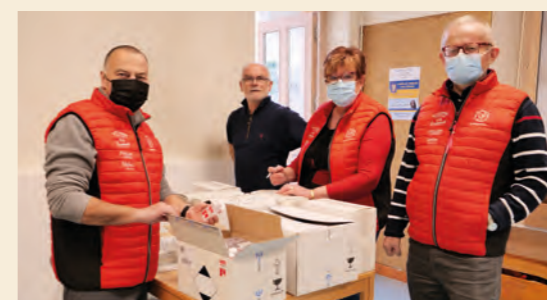
Les bénévoles de l'association Bourgetaine des donneurs de sang réceptionnant des colis en Mairie. L'autre point de collecte de notre commune se trouvant au restaurant l'Incontournable.

En cohérence avec les consignes de la Protection civile, l'association s'est chargée de tout le côté logistique de cette collecte en réceptionnant et triant, mettant dans des cartons scotchés et étiquetés tout ce qui pouvait être utile sur place. Parmi ce matériel : des produits d'hygiène corporelle et de soins ou de prise en charge de premiers secours, des médicaments, du matériel médical (béquilles ou attelles), beaucoup de nécessaires pour bébé (lait et couches), des couvertures, des sacs de couchage. Des dons financiers ont également été apportés (les chèques ont été remis à la Croix-Rouge française).