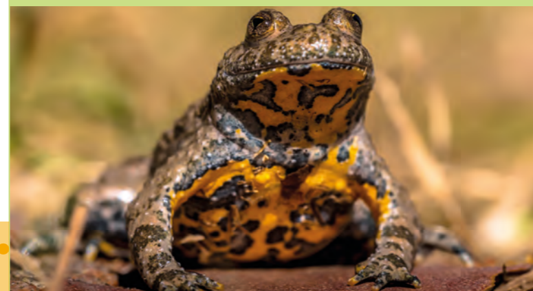
La sortie participative "Sonneur à ventre jaune" aura lieu le samedi 07 mai 2022.

C'est un outil qui a pour but d'accompagner une commune dans la prise en compte de la biodiversité sur son territoire. L'objectif est de connaître, de valoriser et de préserver le patrimoine naturel d'une commune en impliquant l'ensemble des acteurs.