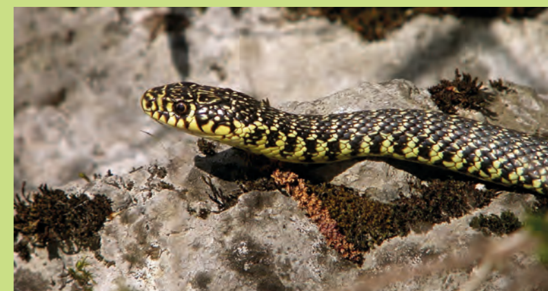
La sortie participative "Couleuvres" aura lieu le samedi 21 mai 2022 en matinée.

Enfin, pour conclure l'ABC, les résultats seront restitués et diffusés de façon à être intégrés dans les politiques publiques.